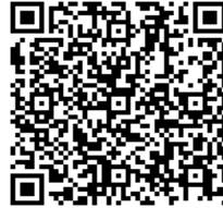
製品ページQRコード