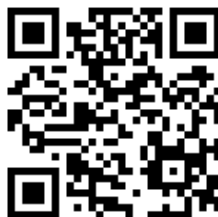
ホームページQRコード