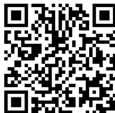
ホームページQRコード